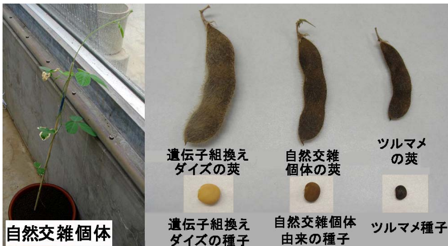
図3. 遺伝子組換えダイズとツルマメの自然交雑個体(左)および莢と種子 交雑種子を栽培すると、得られた莢と種子の大きさ、種子の色は中間的でした。