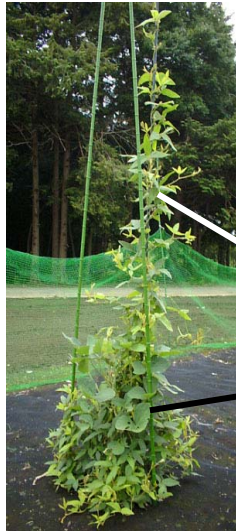
図1. 遺伝子組換えダイズ（40-3-2 系統）およびツルマメの栽培状況（撮影日 2005 年 8 月 31 日）隣接して栽培すると、夏季にはつる性のツルマメは組換えダイズに巻きついた状態となりました