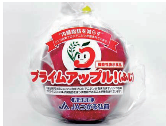
図2 リンゴで初めての機能性表示食品「プライムアップル！（ふじ）」