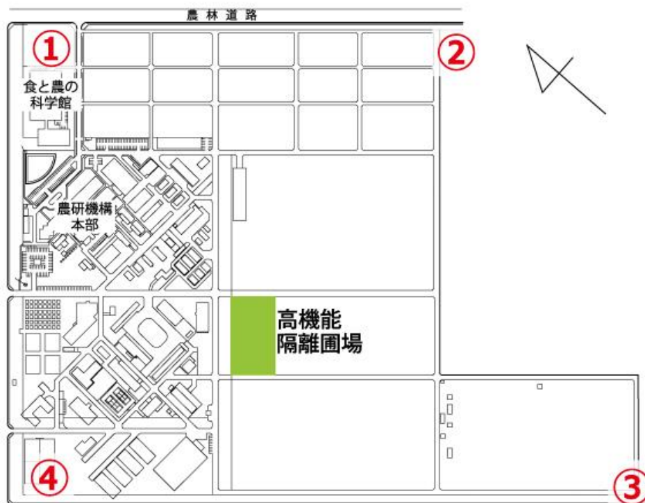
図 3 観音台第 1 事業場高機能隔離圃場（緑色）周辺のモニタリング用モチイネの配置図 ①から④の位置で、花粉飛散モニタリング用モチ品種「モチミノリ」等を栽培します。