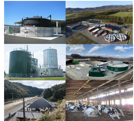
お世話になっている現場の一部です。現場のご協力なしには研究は進みません。ありがとうございます！