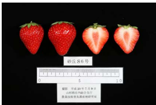
図2 四季成り性イチゴ「サマーティアラ」の果実 「砂丘S6号」は系統名

x レオメータ使用、3mm円柱形 60mm/s貫入応力(月1~3回、5~10果調査) -は未調査(「エッチェス-138」は10~11月未調査)