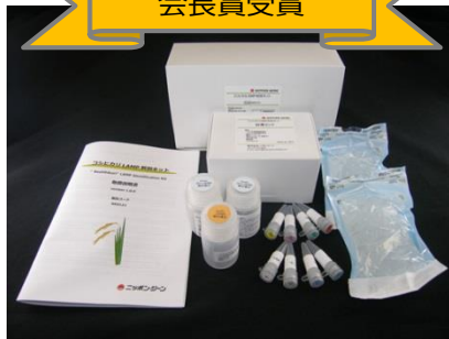
コシヒカリLAMP判別キット（株式会社ニッポンジーン） 平成24（2012）年末から販売