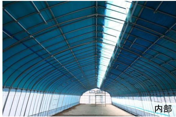
図4 パイプハウス蚕室