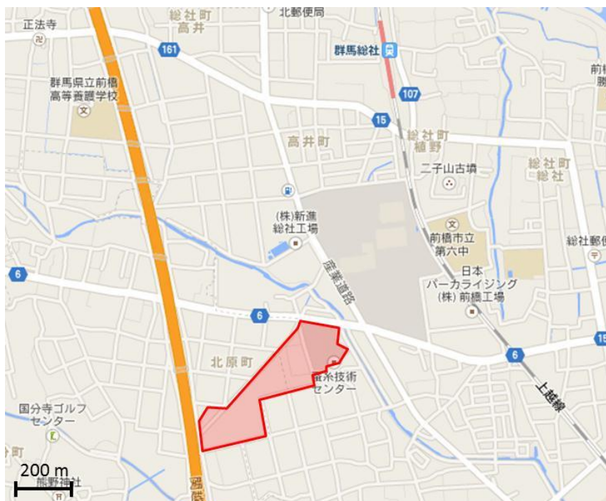
図2 蚕糸技術センター周辺の地形図（Google マップより） 赤く囲んだところが蚕糸技術センターの敷地