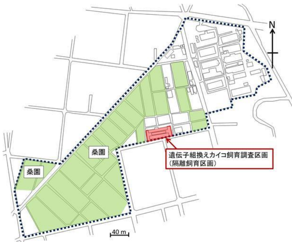
図3 群馬県蚕糸技術センター内配置図 赤く囲んだところが隔離飼育区画