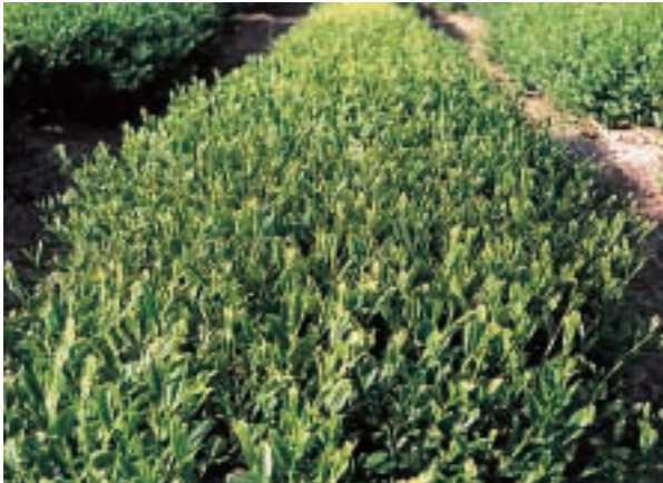
写真-1 ‘はるみどり’一番茶の生育状況