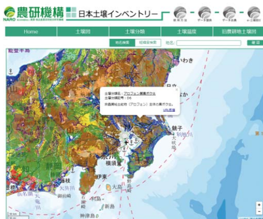
全国デジタル土壌図 (縮尺 20 万分の 1 相当)