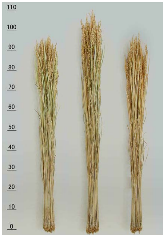
写真1 株標本（左から、「萌えみのり」、「ひとめぼれ」、「はえぬき」）

撃を受けるものの、倒伏は「はえぬき」と同程度で、玄米収量は61.8kg/aと「はえぬき」より6%多収である（表4）。土中播種した際の低温苗立ち性は「Arroz da Terra」より劣り、「ひとめぼれ」並かやや優る“中”である（表12）。