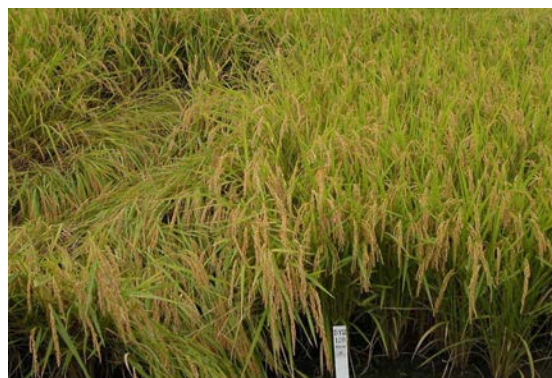
写真2 直播栽培（表面散播400粒/m 2 ）における草姿（左：「あきたこまち」、右：「萌えみのり」）