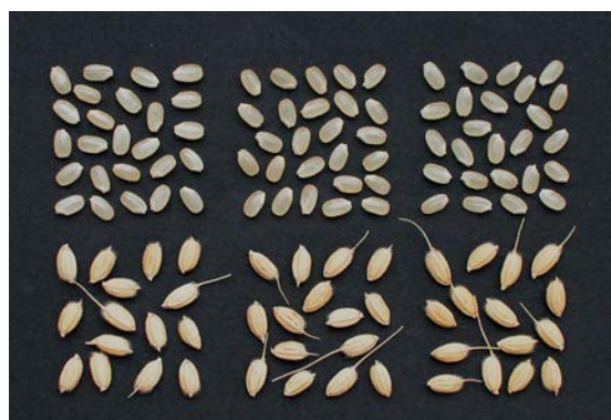
写真3 籾及び玄米（左から「萌えみのり」、「ひとめぼれ」、「はえぬき」）