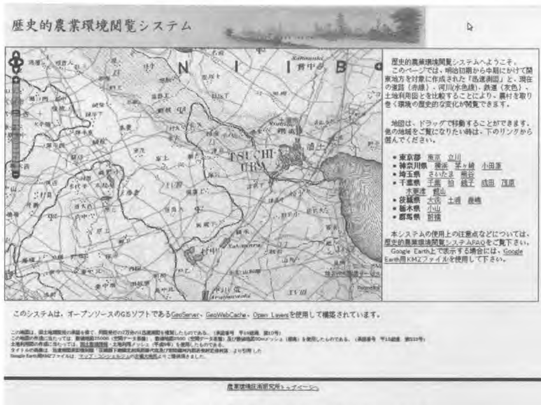
図6 HABS 上での「大日本土性図・常陸全国」の表示例

また、当所の農業環境イベントリーセンターが所有する地図資料の一つに、マックス・フェスカの指導により明治初期から昭和にかけて作成された大日本土性図がある。この資料は全国土を対象とする土壌図としては世界最古のものであるとともに、歴史的な農業活動と自然環境の関係を明らかにする上でも、重要な資料である。さらに、経時的劣化や散逸を防ぐためにも、デジタル・アーカイブ化が必要である。そこで、農業環境イベントリーセンターにてデジタル・アーカイブ化および幾何補正を行ったデータをHABS上で閲覧出来るようにし、迅速測図との比較を可能にする予定である。図6は試験環境下で大日本土性図・常陸全国の一部、茨城県土浦市からつくば市にかけてを表示したものである。水涯線から河川や地形を読み取ることができ、低地沿いと台地上で異なる土壌タイプが分布していることが読み取れる。