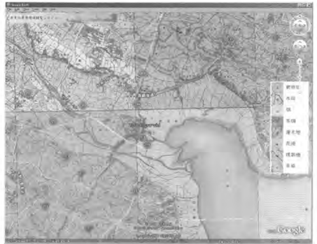
図3 Google Earth 上での表示例