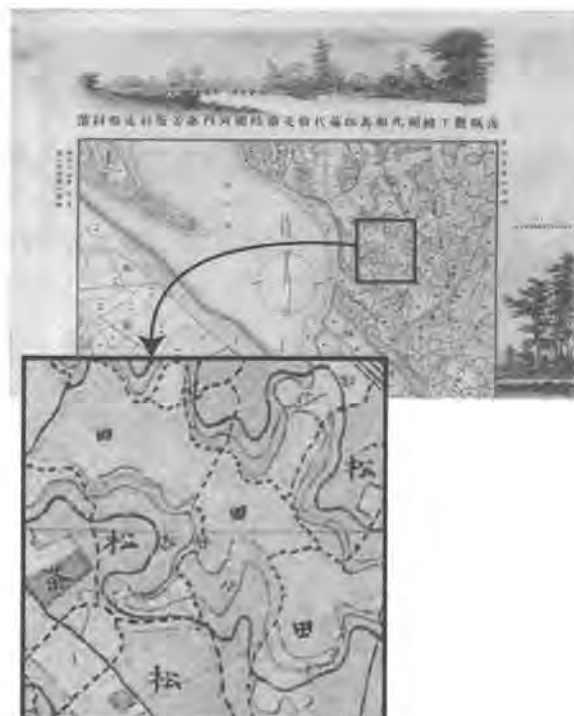
図1 茨城県牛久市牛久沼周辺の「迅速測図」。拡大すると，樹種や土地利用が記載されている。

迅速測図とは、三角点による測量網が出来る前の簡易的な測量法の名称であるとともに、それにより作製された地図の総称でもある（財団法人日本地図センター，2003）。このうち「第一軍管地方二万分一迅速測図」（以下，迅速測図）は，関東平野と三浦，房総の両半島を測量範囲とし明治13年から19年の間に作製されたものである。この迅速測図は縮尺が1/2万であることや，地目ごとに彩色されていることが特徴であり（図1），近代化以前の土地利用の復元や農耕地の歴史的变化を把握をする上できわめて重要な基礎的資料である。農業環境技術研究所ではこの迅速測図を用いた研究を行ってきたが，この資料のさらなる利用と研究の促進をはかるため，Web-GISシステムとして歴史的農業環境閲覧システム(Historical Agro-Environmental Browsing System, 以下 HABS)を開発し，2008年4月より公開している（岩崎ほか，2009）。ここではHABSの開発について概説するとともに，現在行っているシステムの改良について解説する。