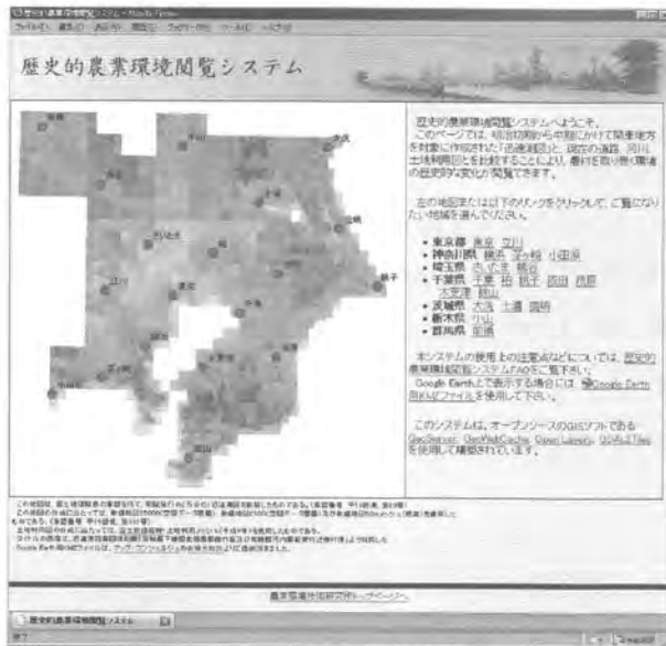
図2 HABSのトップページ

示するか、1997年の土地利用図を表示するか選択できる。このトップページにはGoogle Earthで閲覧するためのKMLファイルへのリンクもあり、図3に示すようにGoogle Earth上に迅速測図を表示することができる。