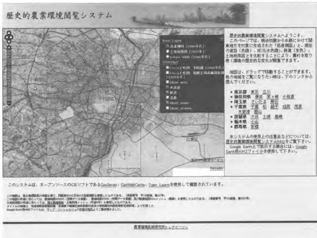
図5 改良中のHABSの画面。基盤レイヤに「五千分一東京図測量原図」を加えるとともに、道路、水涯線、鉄道および、基盤地図情報 25000WMS 配信サービスと地名 WMS 配信サービスの表示の有無を選択できるようにした。ここでは迅速測図を基盤レイヤとし、水涯線、鉄道および地名 WMS 配信サービスを表示している。

システム公開後に提供された Web サービスの一つに、独立行政法人農業・食品産業技術研究機構 近畿中国四国農業研究センター 生産支援システム研究近中四サブチームにより提供され