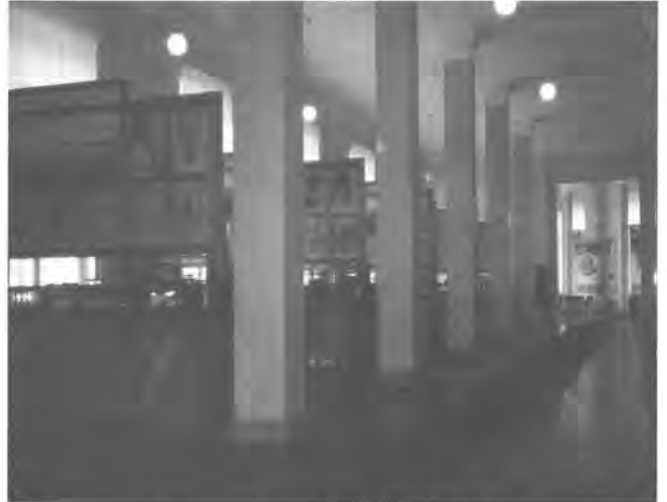
写真4 ウイリアムス土壌農業博物館

1974年、モスクワで第10回国際土壌科学会議が開催され際、筆者が初めて見た土壌博物館が「チミリヤーゼフ農業科学アカデミー」ウイリアムス土壌農業博物館であった(写真4)。ウイリアムス土壌農業博物館は、1943年にV.R.ウイリアムス(1863-1939)の科学と教育における活動の50周年を記念して連邦政府の特別布告により設立された。1000点の土壌モノリスが展示されている。主要な収蔵品は土壌モノリスであり、ロシアは勿論、