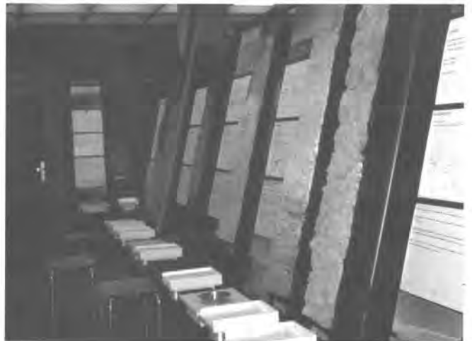
写真5 世界土壌博物館

1966年に国際土壌学会(ISSS)等の要請を受けてオランダ政府によりに"国際土壌博物館(ISM)"が設立された(写真5)。現在は国際土壌照合情報センター(ISRIC)に改組され業務を拡大し、附属博物館は"世界土壌博物館(WSM)"と呼ばれている。世界中から1000点の土壌モノリスが集められ、うち60点が景観写真、土地利用および土壌の特性と管理の情報とともに展示されている。ここの土壌モノリスは、樹脂で固められてはいるが数センチメートルの厚みをもち自然の構造等