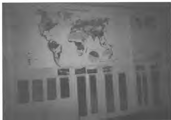
写真3 ドクチャーエフ中央土壌博物館

土壌モノリスの収集は19世紀末にロシアで始められた。ロシアの土壌学者たちは1893年シカゴで開催された万国博覧会に土壌断面標本を出展し、これによりアメリカに土壌標本採取法が伝わった。1904年にサンクトペテルブルグに設立された”ドクチャーエフ中央土壌博物館”は世界最古の土壌博物館である（写真3）。1600の貴重な土壌モノリスと11600点の関連資料を収蔵している。展示は、自然帯別の土壌の多様性を見るだけでなく、土壌