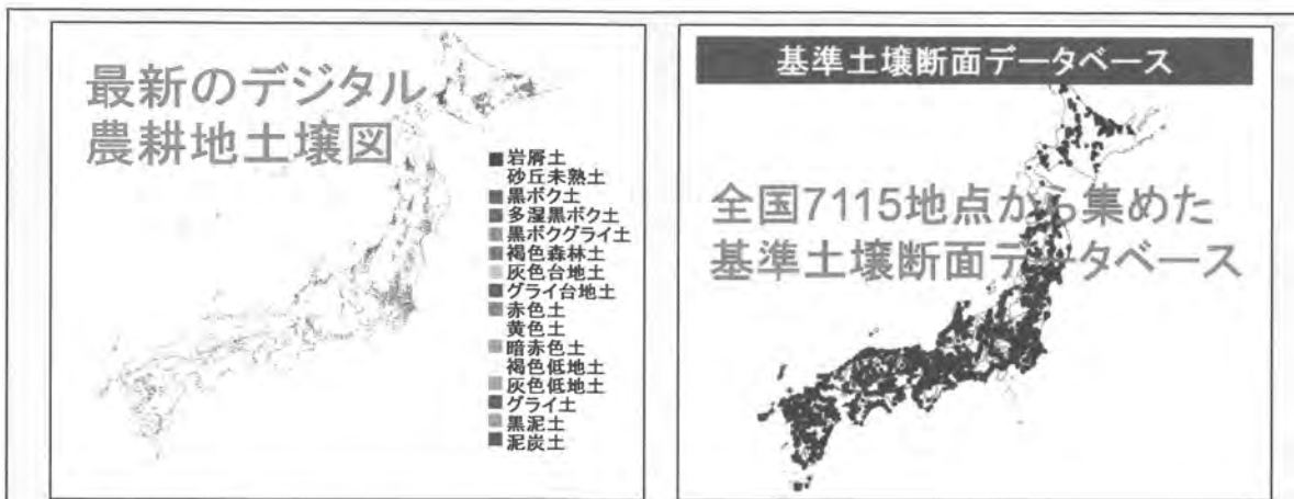
図1 土壌情報閲覧システムの内容 土壌情報閲覧システムは最新の農耕地土壌図（左）と1953年から73年までに全国で集めた基準土壌断面に関するデータベース（右）から成ります。