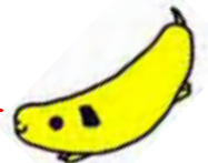
マスコット： バナナ犬