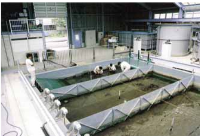
図・ 3 底生生物のモニタリングの様子