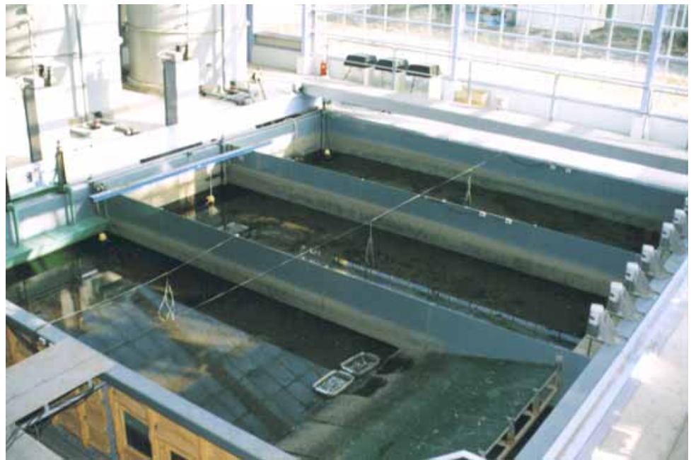
図・ 2 メソ コスム水槽