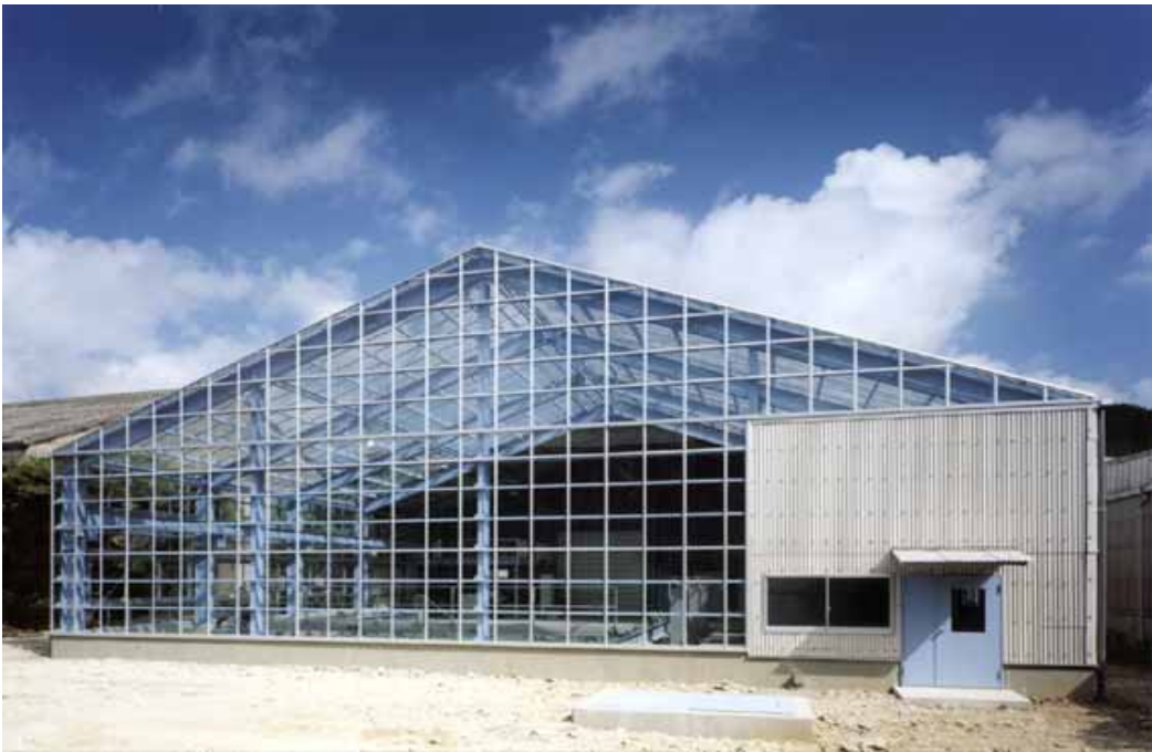
図・ 1 干潟メソ コスムの外観