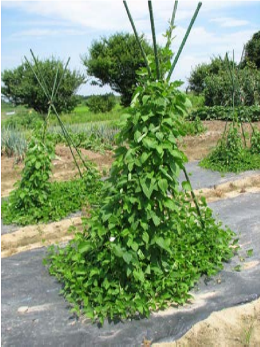
野生大豆の植物体

ツルマメとも呼ばれ、中国、朝鮮半島、日本、ロシア東部などに自生しています。栽培大豆の学名が Glycine max であるのに対し、 Glycine soja と、別種として扱われていますが、交配は可能です。栽培大豆は、3000年-5000年ほど前に、中国で野生大豆が栽培化され誕生したと考えられています。