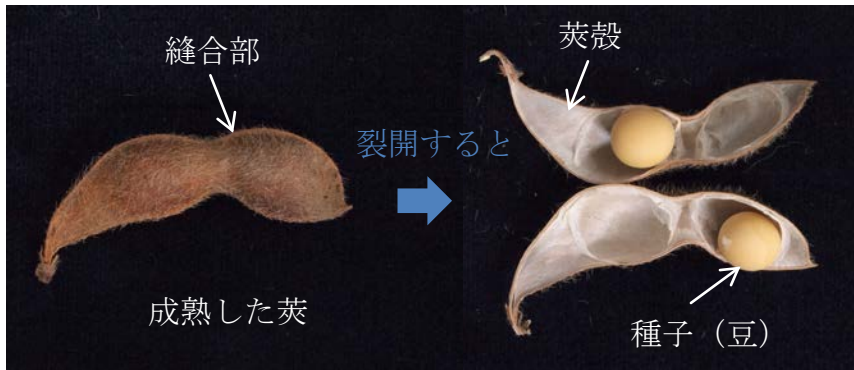
図 1. 大豆の莢の構造