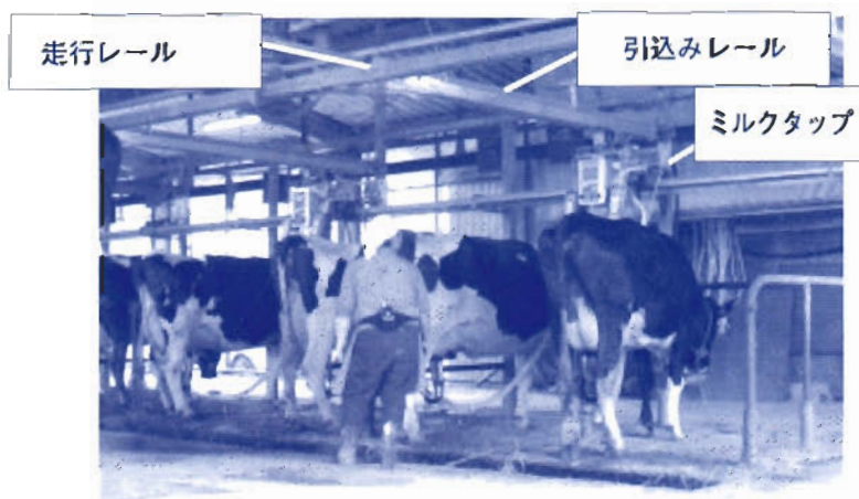
図2 2頭同時搾乳の様子