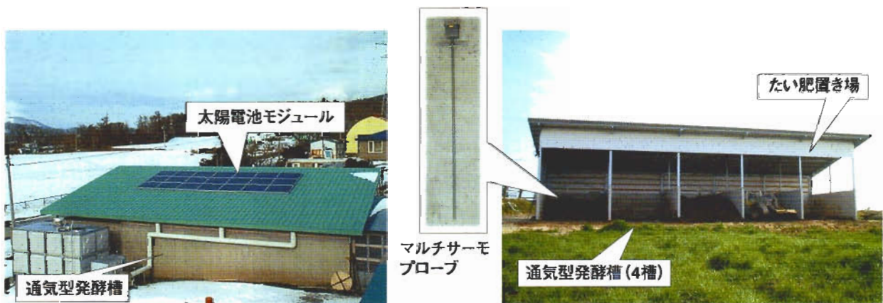
図1 自然エネルギー活用型高品質堆肥化装置