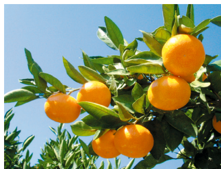
写真1 カンキツ新品種 ‘肥のあかり’ の結果状況

以上のことから‘肥のあかり’は‘豊福早生’出荷前の9月下旬から出荷可能で、樹勢が強く、高品質極早生ウンシュウとして期待できる。