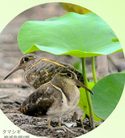
タマシギ 絶滅危惧II類