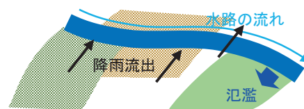
降雨流出と氾濫は局所慣性方程式を基礎式とし、陰解法を適用