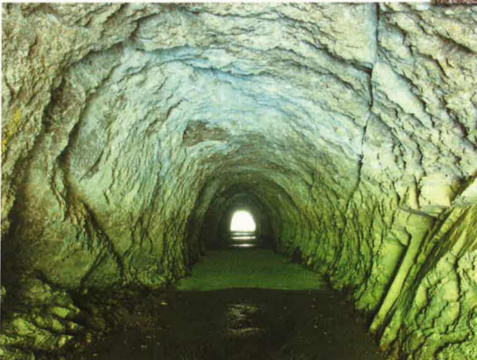
柳谷トンネル (素掘り隧道)