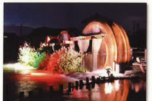
あさくら三連水車 (ライトアップ時)